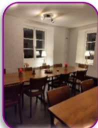
Brotschi-Stube Essen & Trinken mit WC ab 1100h