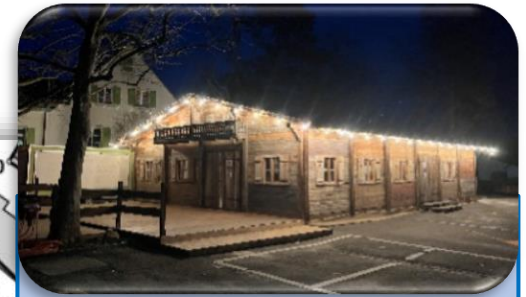
Holzchalet auf dem Dorfplatz Ab 1100h Barbetrieb mit DJ-Musik