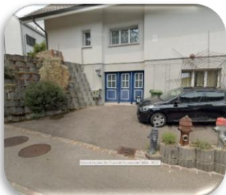
Getränkestand in der Rüttigasse Diverse warme/kalte Getränke & Currywürste 1200-1700h