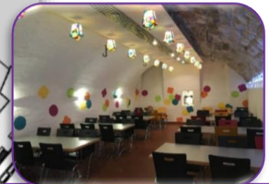
Halbmond-Clique-Keller Barbetrieb mit Essen / WC Geöffnet ab 1100h Eingang via Baslerstr.