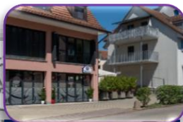
Restaurant Rebstock / WC