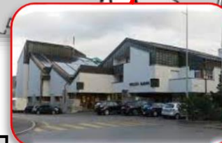
Saal Wilder Mann Geschlossen