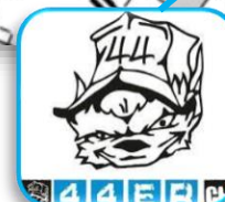
44-ER Shop / Sommer Grill / Getränke 1100h