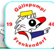
GP-Chäller Barbetrieb / WC