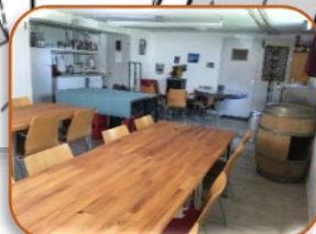
Gnusschäller 1100-1300h & 1600-0000h