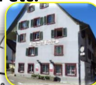
Restaurant Central / WC