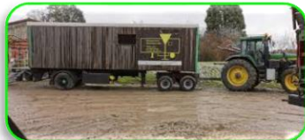
Barmeile mit div. Wagen Nach dem Umzug offen

Food-, Bar- & Keller-Übersicht..... was ist wo & wann etc.